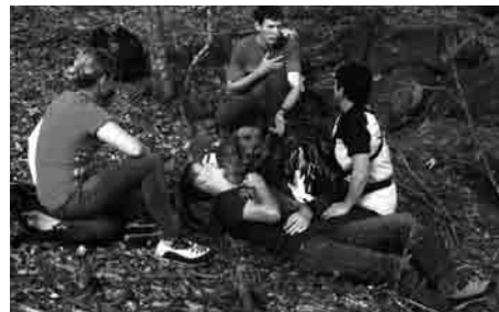
Der «Patient» und seine Begleiterin werden kurz nach dem Auffinden durch die Retter betreut

Ende August, fand die alljährliche Alarmübung statt. Übungsanlage: Ein junges Paar war auf dem Abstieg vom Buschachen Richtung Marbach als der Mann von einem Insekt gestochen wurde und aufgrund einer starken allergischen Reaktion nicht mehr weitergehen konnte. Seine Begleiterin alarmierte mit dem Natel die Rega, konnte jedoch keine genauen Angaben zum Standort machen. Dank dem Einsatz eines Geländesuchhundeteams konnten die beiden rasch gefunden, durch die Retter medizinisch versorgt und abtransportiert werden.