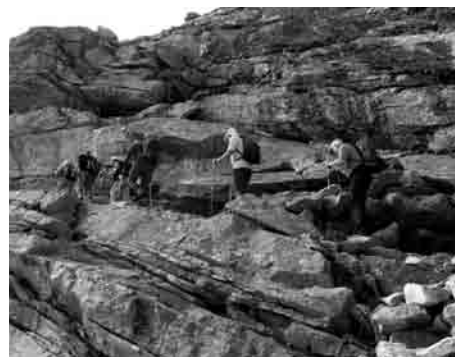
Auf dem Erlebnisweg

einem feinen Mittagessen konnten wir uns an den handzahmen Murmeltieren ergötzen. Auf dem Heimweg durfte manche Wanderin noch die Kneippanlage geniessen (mit Frottiertuch aus Dorli's Rucksack). Im Hotel angelangt klärte sich auch das Rätsel um die vermissten Schuhe auf: Ein Power-Teilnehmer in Socken hatte das Paar auf dem Sack aufgebunden!!